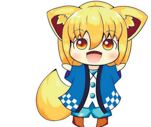
▲理大祭のマスコットキャラクター「りかまる」

「りかまる」は神楽坂地区理大祭のキャラクターで、日本の科学発展を望み、日本の科学発展を望むために現れた妖精である。昨年、マイナビスタチューデント主催の全国学園祭マスコット総選挙において3位であった。今年こそ1位を目指している。今年こそ1位を目指していただきたい。 また、理大祭ではりかまるのキャラクターグッズが販売されている。3色ボールペンやクリアファイルなどがあり、理大祭前は生協で、理大祭中は神楽坂喫茶のある3号館ピロティーと生協前で販売される。