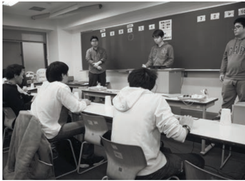
▲QMAのクイズ大会の様子

3号館3階にある333教室では、QMA研究会による「QMAクイズ企画」が行われている。この企画では、検定クイズや早押しクイズ大会が開催されている。 検定クイズは会員自作であり、出題形式はさまざまである。○×や一問他答更にはシルエット当てなどがある。クイズの種類は多岐に渡っており、大きく分けて「アニメ・漫画・ゲーム」と「学問・知識」の2つに分けられる。「アニメ・漫画・ゲーム」ジャンルでは240個ものクイズが用意されており、「ラブラブ！検定」や「ジョジョの奇妙な冒険検定」、「DQドラゴンク