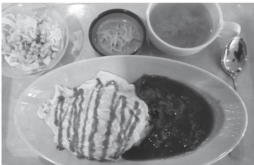
▲FOREST KITCHEN のオムライス 450円

学食の上階にはフードコートもある。そこにはもちろんちび食感が堪らないパスタ専門店やジュウジュウという音が食欲をそそる鉄鍋専門店、さらに鉄板に盛りだたした熱々のハンバーグなどを扱っている洋食専門店や、日替わりの惣菜が選べさらに餃子がセットで食べられる選べて楽しい中華専門店の4店舗が入っている。どの店舗も昼食時には常に行列ができるほどの人気である。また昼食だけでなく朝食も取り扱っており、朝食を食べ損ねたり、作るのが面倒臭くなってしまう学生には嬉しいサービスだろう。