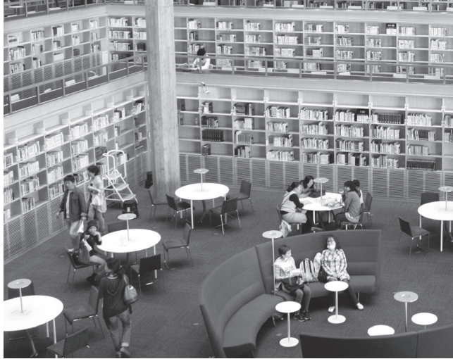
▲5月から一般開放された図書館の様子

表、会議の場としての活用が期待される。次に食堂は、キャンパスモールに面している管理棟の1階と2階にあり、学生と地域住民が交流する場ともなっている。外部空間と内部空間の一体感に配慮した造りとなっており、約1000席と非常に広い。営業時間は平日8～19時、土曜11～15時である。 最後に、体育施設となる体育館、テニスコート、グラウンドについて説明する。体育館の利用は体育事務室に申請すれば可能である。体育館の2階にはトレーニングルームがあり、こちらは体育館の開館時間内であれば自由に使用することができる。テニスコートとグラウンドは区が保有しているため、利用には使用料が発生するが、大学で確保している時間帯は無料で使用でき、体育事務室が受付している。