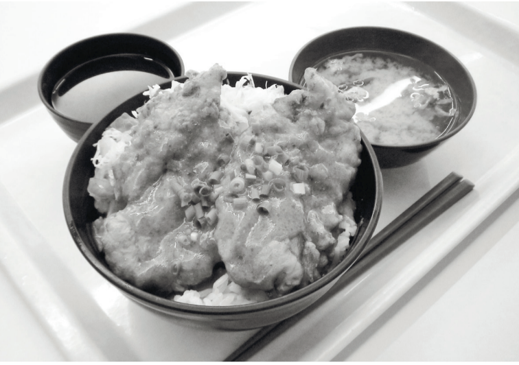
▲神楽坂キャンパスでも新たに提供が始まった「ささみうま辛丼」